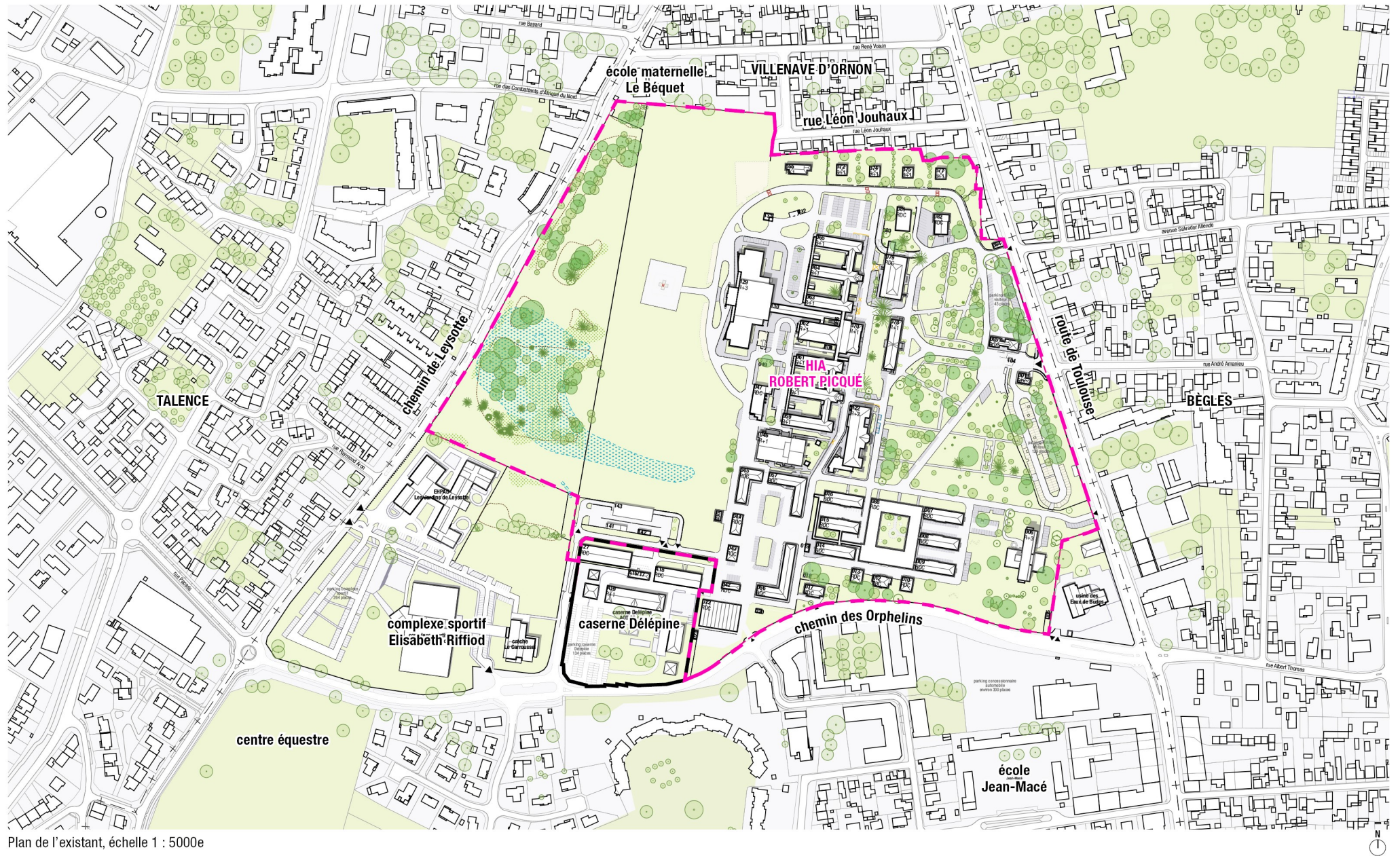
Plan de l'existant, échelle 1 : 5000e