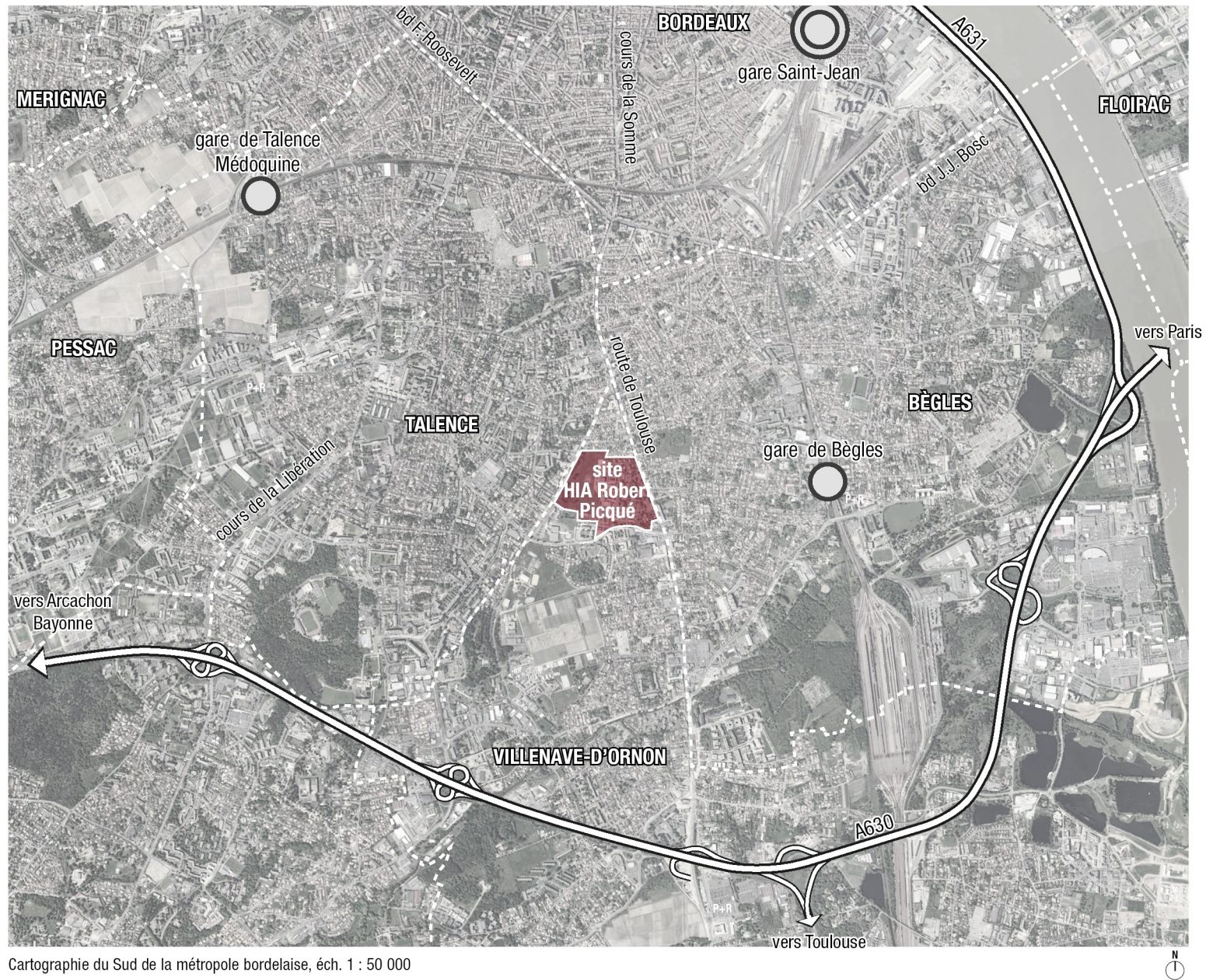
Cartographie du Sud de la métropole bordelaise, éch. 1 : 50 000