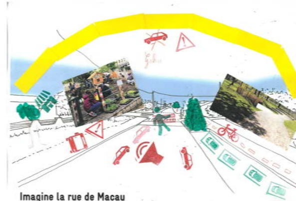
Imagine la rue de Macau