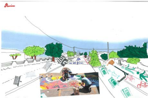
Imagine la rue de Macau