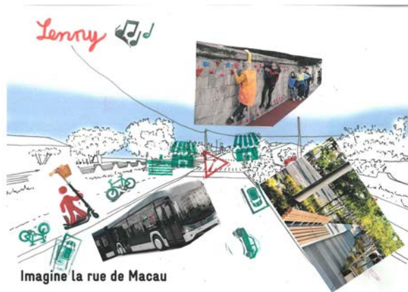
Imagine la rue de Macau