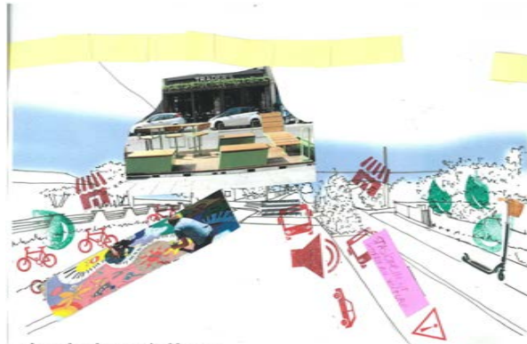
Imagine la rue de Macau