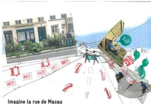
Imagine la rue de Macau