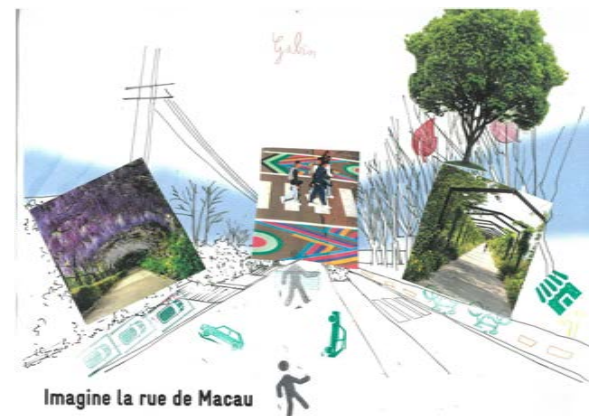
Imagine la rue de Macau