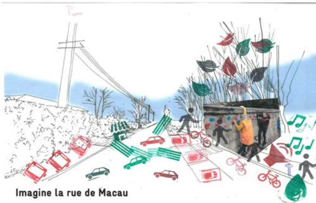
Imagine la rue de Macau