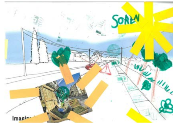
Imagine la rue de Macau