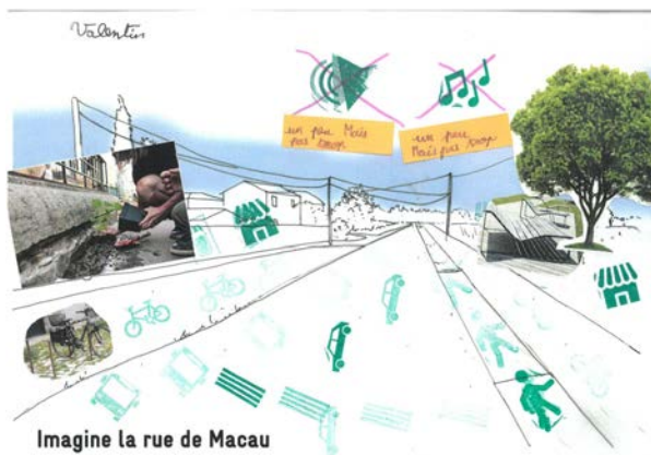
Imagine la rue de Macau