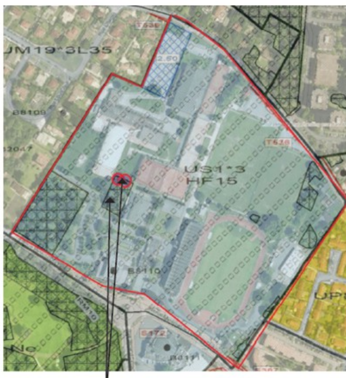
EBC à réduire pour la réalisation du projet