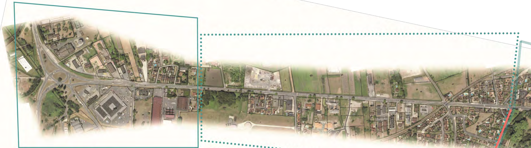
Séquence 1 : CANTINOLLE : CARREFOUR COMPLEXE DANS LA ZONE COMMERCIALE