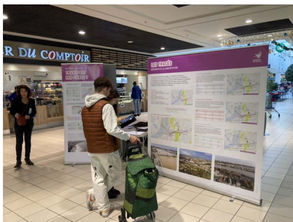
Centre commercial les 4 Pavillons Le 2 décembre 2022