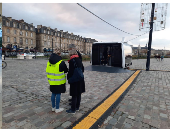
Quai Richelieu Le 3 décembre 2022