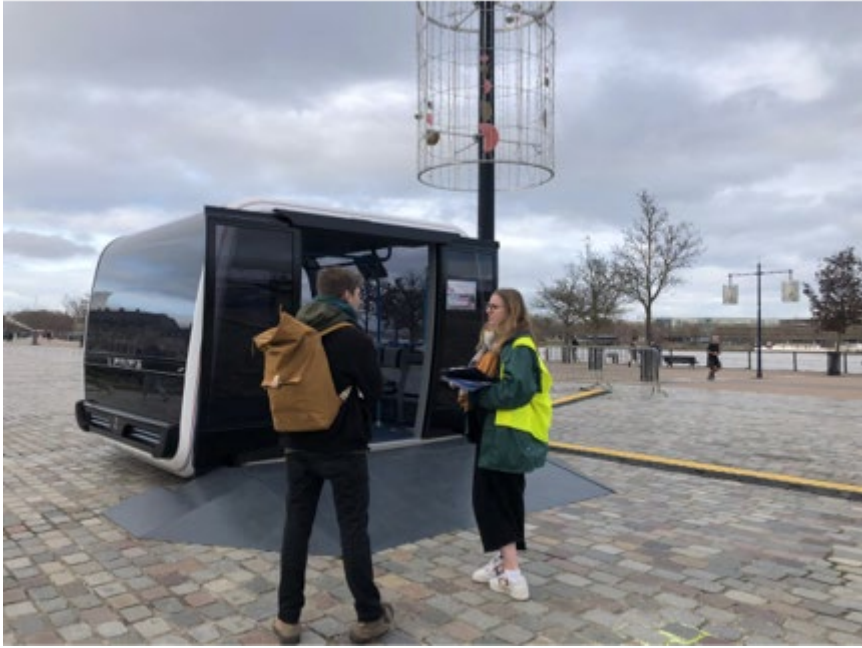
Stand exposition – Quais Richelieu