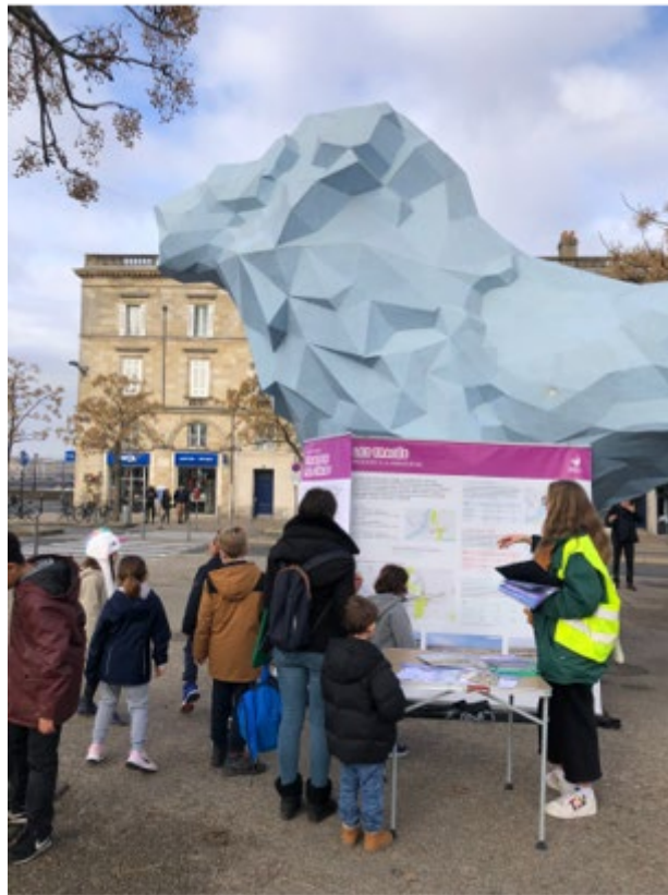
Place Stalingrad à Bordeaux