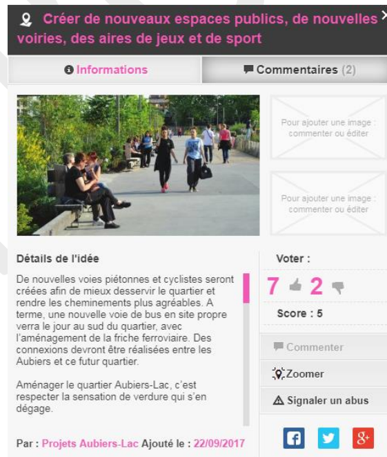
Fenêtre d'information pour une idée du site Carticipe

Carticipe est un outil de transparence. Les idées formulées sur le site apparaissent sous forme de bulle qui donnent accès à une fenêtre d'information comme présenté ci-dessous. Elle permet ainsi d'avoir les détails de l'idée, de consulter ou laisser un commentaire ainsi que de prendre connaissance des votes qu'elle a engendrés.