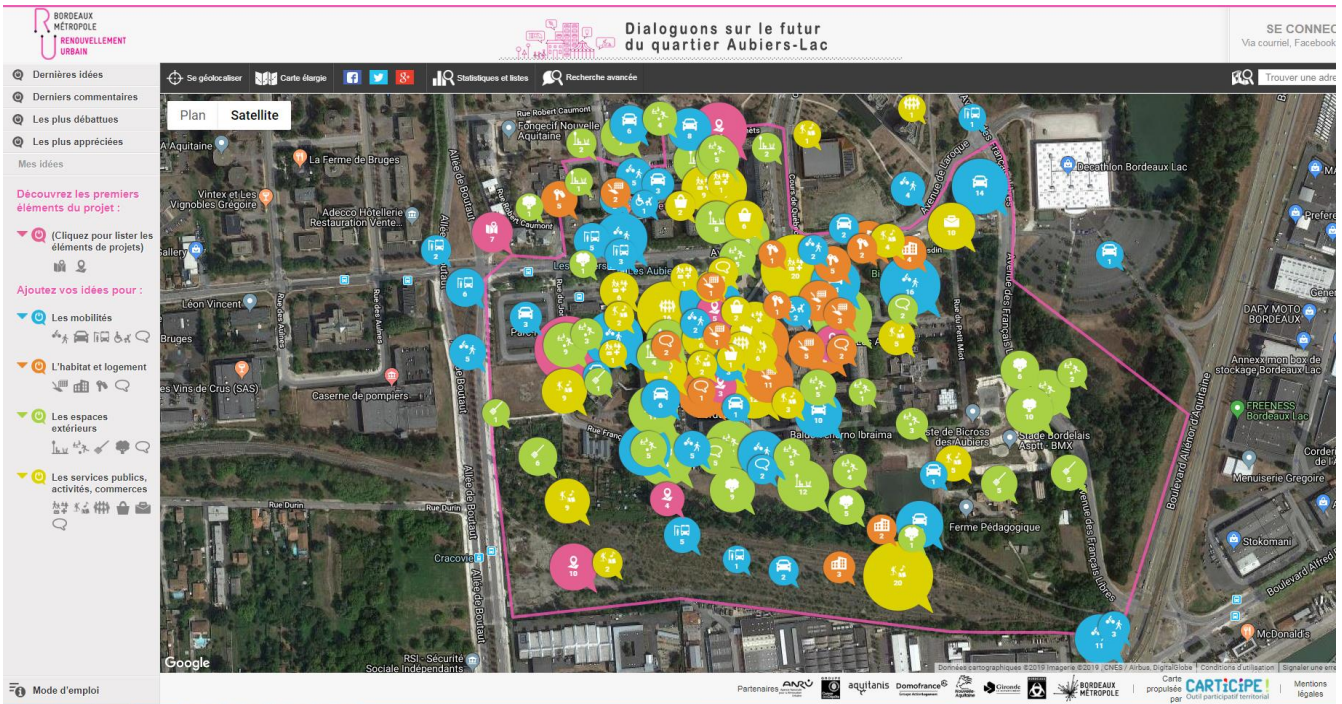
Site internet Carticipe spécifique au projet Aubiers-Lac

Carticipe est un outil de transparence. Les idées formulées sur le site apparaissent sous forme de bulle qui donnent accès à une fenêtre d'information comme présenté ci-dessous. Elle permet ainsi d'avoir les détails de l'idée, de consulter ou laisser un commentaire ainsi que de prendre connaissance des votes qu'elle a engendrés.