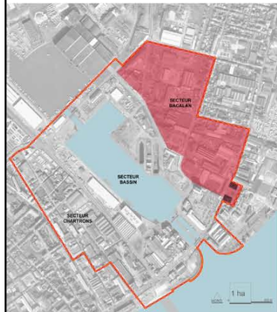
SECTEUR 3 BACALAN ILOT 14