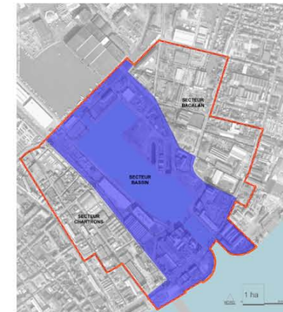
DETAILS ZONE BASSINS A FLOT