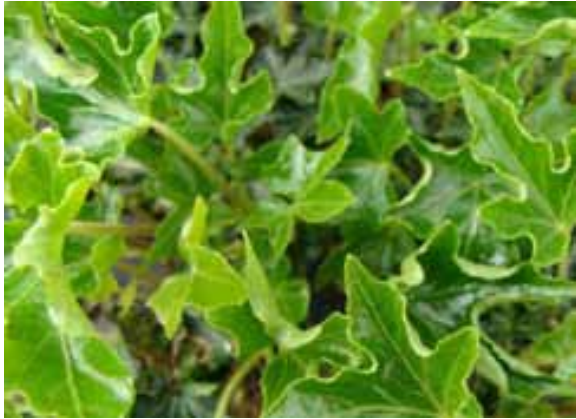
Hedera helix ivalace