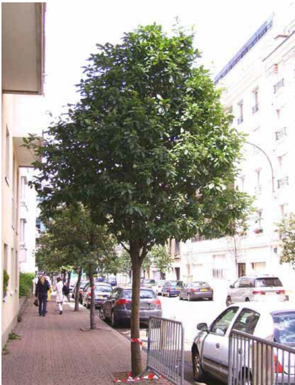
Sorbus aria entre stationnement côté est de la rue Austin Conte