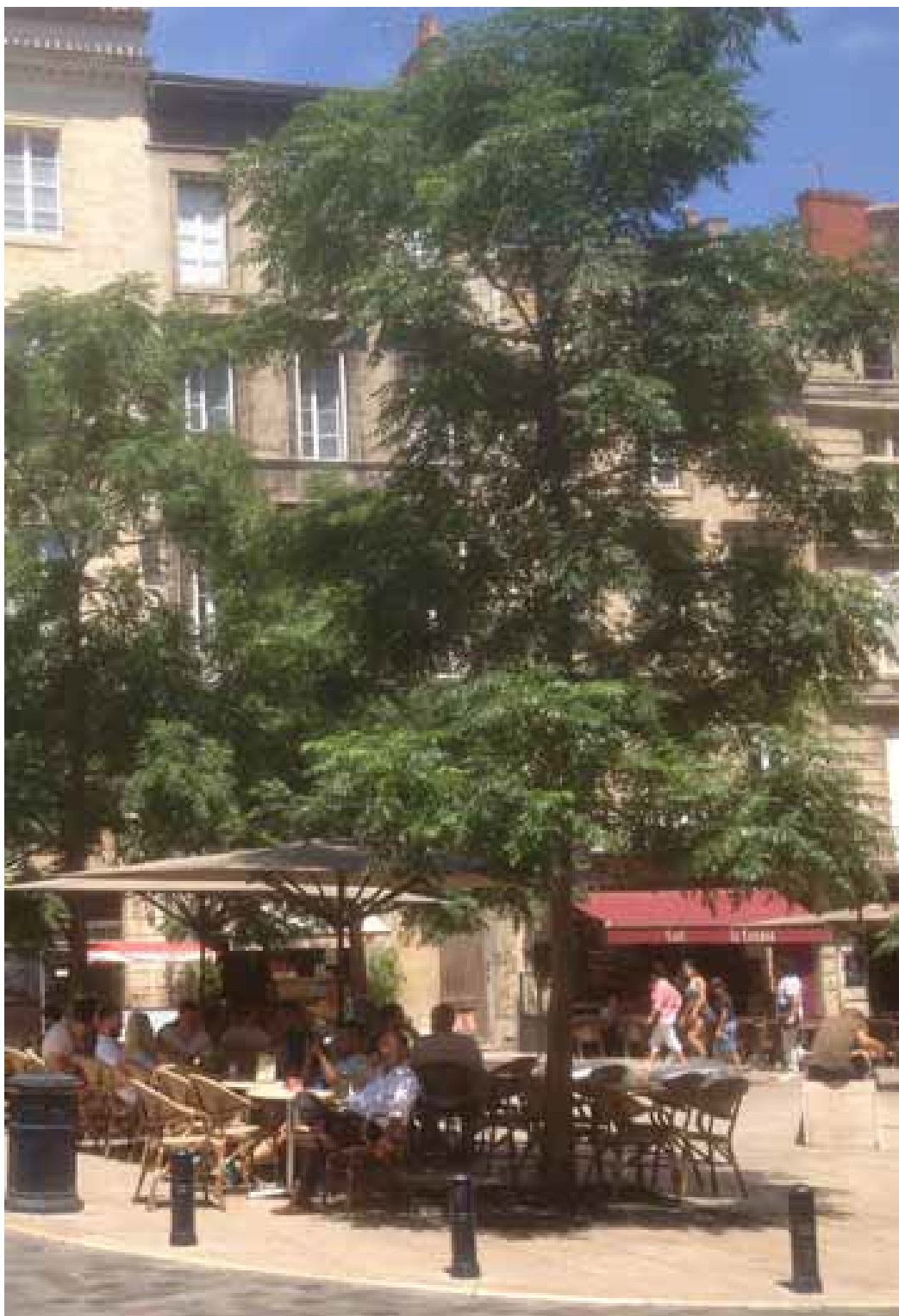
Melia azeradarach sur la place, au niveau des terrasses