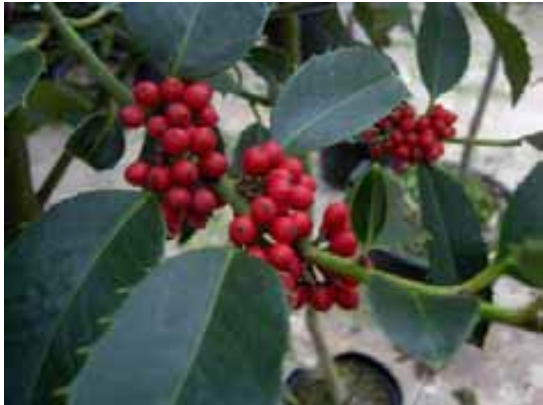
Ilex aquifolium castaneifolia

Principe d'un massif densément planté, avec une végétation persistante, mais assez basse, qui permet un adossement tout en gardant une transparence visuelle au niveau du promeneur.