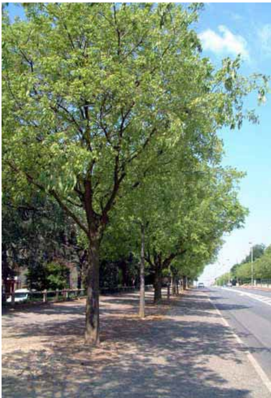
Celtis australis en alignement sur la promenade plantée.