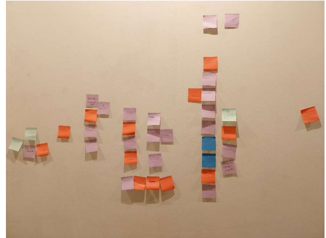
L'ensemble des post-its placés sur le mur, ordonnés par l'animateur