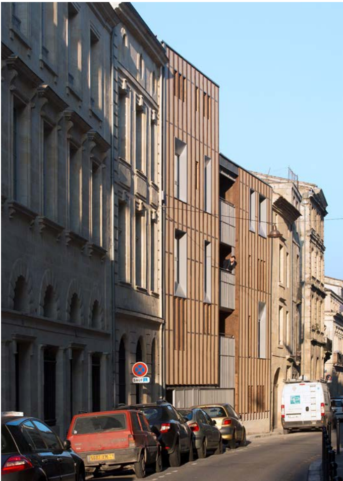
Opération Triptik, rue Carpenteyre, Bordeaux

Enfin, cette opération tire son nom « Triptyk » du fait qu'elle associe trois types de logements dans la profondeur de la parcelle ; Sur rue, un immeuble de logements collectifs ; En milieu de parcelle, des maisons en bandes accolées sur deux niveaux autour d'un patio ; Au fond, trois maisons individuelles avec jardin traitées chacune avec des matériaux différents. C'est une belle illustration, pour une opération de logements entièrement sociale, de la modernité qui peut être introduite dans la ville traditionnelle.