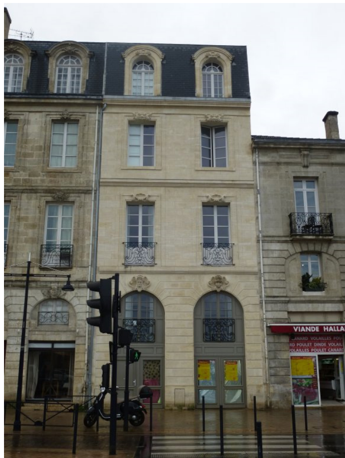
Immeuble Quai de la Monnaie, Bordeaux