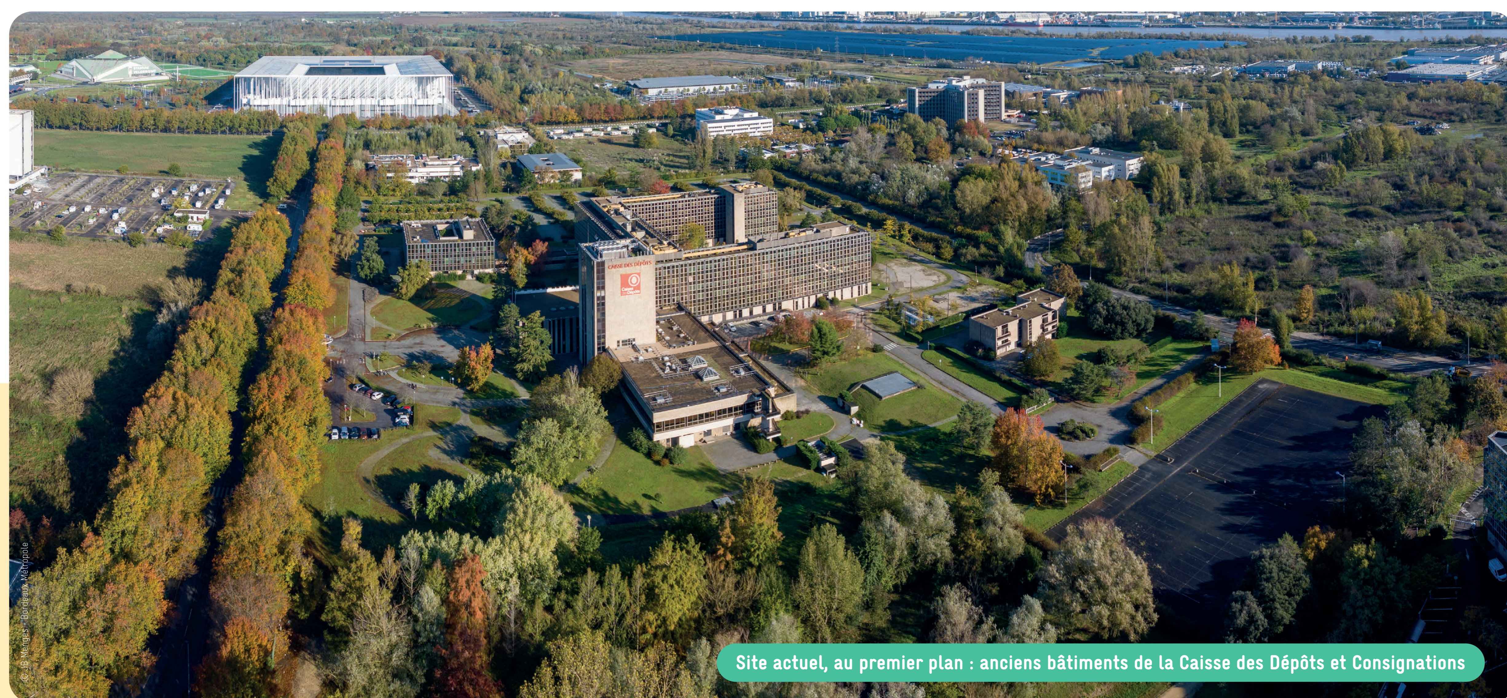
Site actuel, au premier plan : anciens bâtiments de la Caisse des Dépôts et Consignations