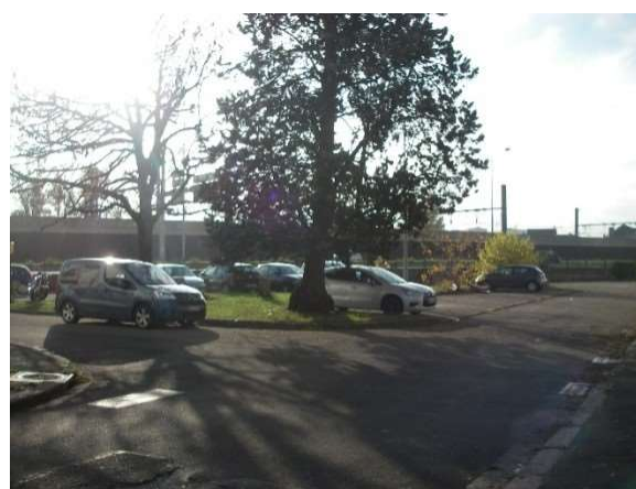
Parking situé entre la Tour 2 et le Bâtiment C

Les emprises concernées sont affectées à la circulation et au stationnement ; elles sont ouvertes au public mais servent essentiellement aux résidents.