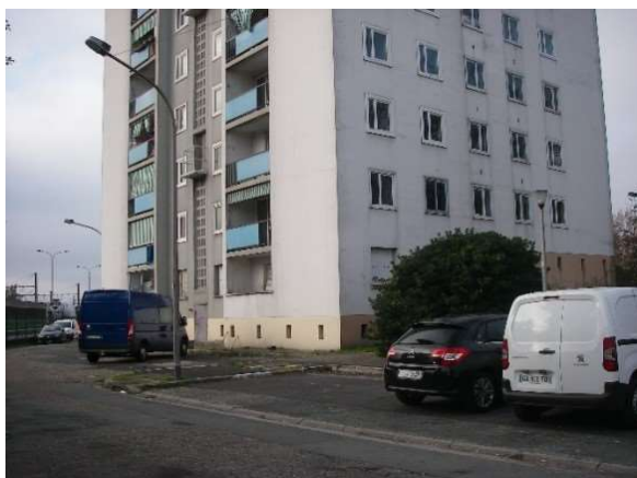
Angle nord-est de la Tour 1, nord de la rue du Professeur André Lambinet.