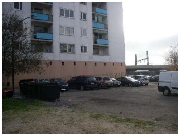
Parking situé à l'ouest de la Tour 1