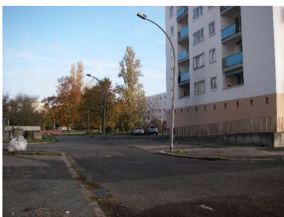
Carrefour entre la rue du Professeur Calmette et la rue du Professeur André Lambinet, angle sud-ouest de la Tour 2.