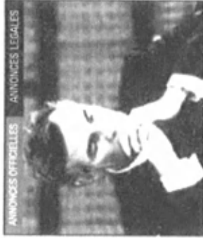
ANNONCES OFFICIELLES ANNONCES LEGALES