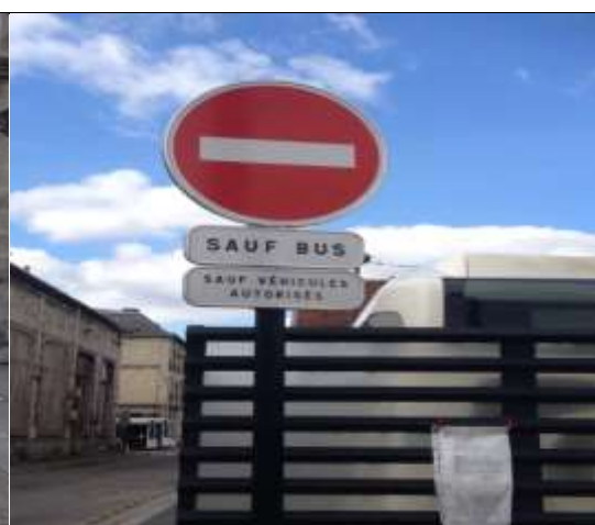
Accès interdit sauf bus