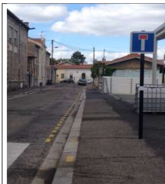
Barrière provisoire rue du Commandant Marchand.