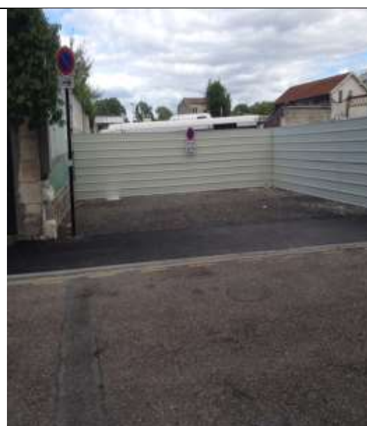
Raquette de retournement située proche des n° 11 et n° 14 du commandant Marchand.