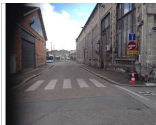
Accès interdit sauf bus