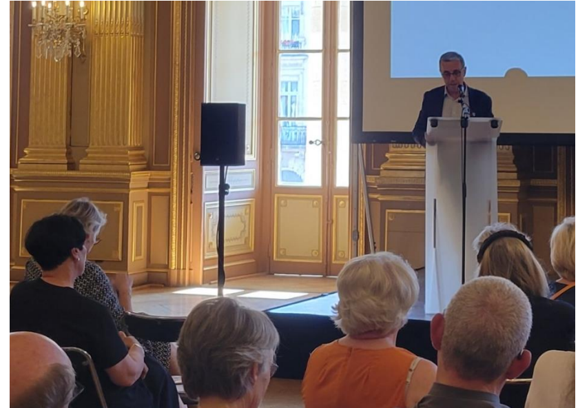
Prise de parole de Pierre Hurmic, Maire de Bordeaux

Remarque : La partie des allées de Tourny la plus proche de la place Sainte Catherine est très bruyante. Si des animations sont prévues, comment faire en sorte que le bruit ne soit pas trop présent ? Les normes en matière de bruit dans la ville ne sont pas respectées. Il faut que les allées de Tourny deviennent un espace où l'on peut se ressourcer, avec un contrôle accru du bruit.