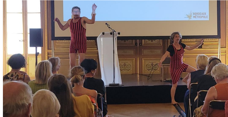
Intervention des comédiens

Réponse : Deux rencontres dédiées aux acteurs économiques ont été organisées durant la concertation.