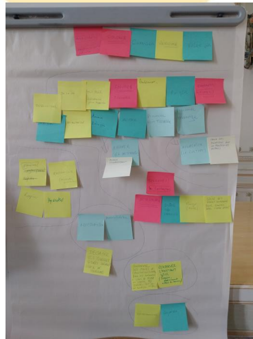
L'ensemble des post-its, ordonnés par l'animateur