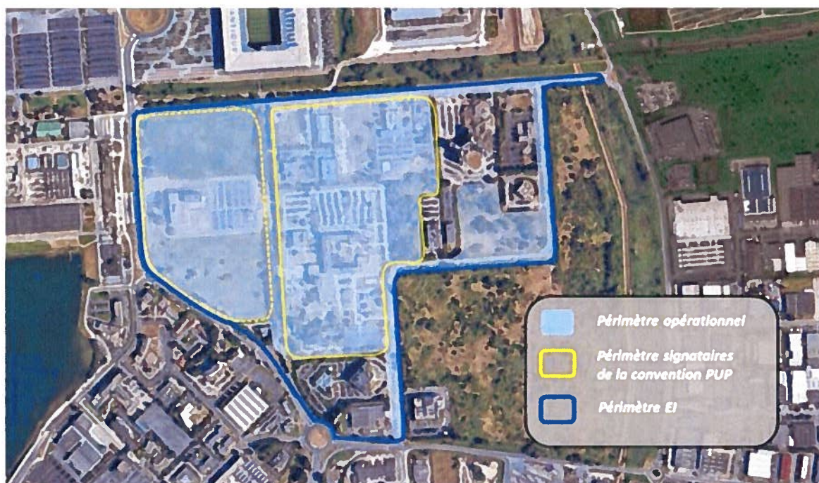
Périmètres prévisionnels d'intervention, susceptibles d'évoluer à la marge