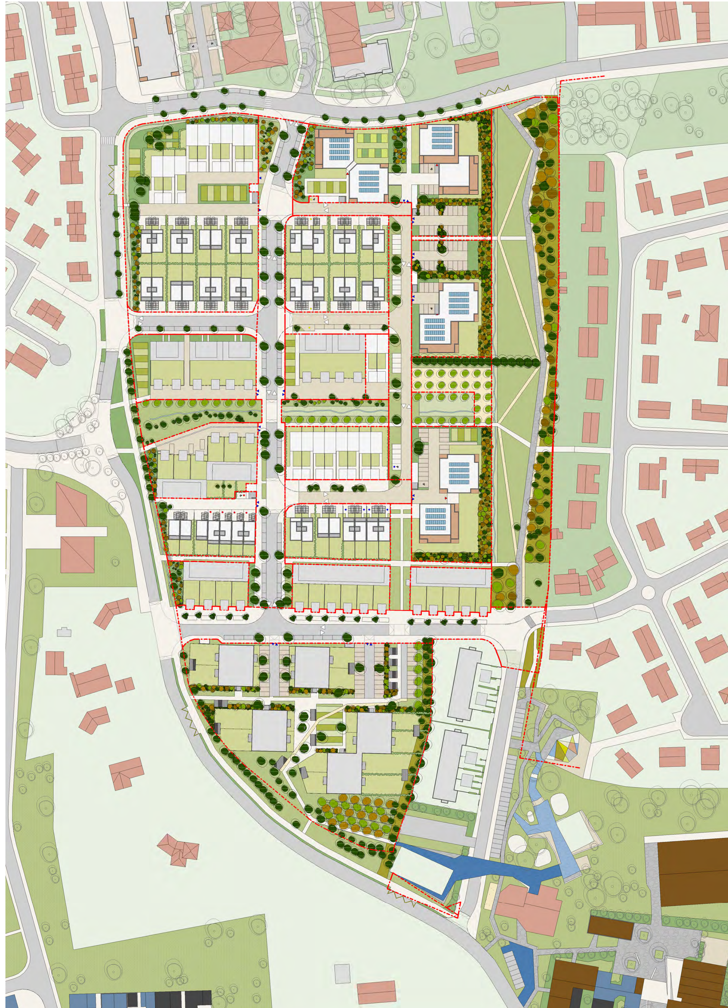
Plan guide du projet urbain du secteur Prévert (en cours de modification)