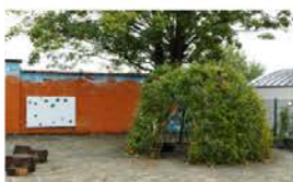
Cabane végétale : naturel, léger, peut se détruire, se refaire → ça vit !