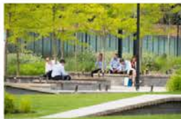
Place piétonne avec assise et fosses plantées : prise en compte de tous les âges.

« Il ne faut surtout pas de lac ou de mare ! Ça attirerait les moustiques. »