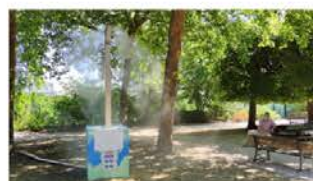
Éléments d'eau/brumisateurs : une bonne idée sur le principe mais non viable d'un point de vue écologique