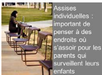
Assises individuelles : important de penser à des endroits où s'asseoir pour les parents qui surveillent leurs enfants