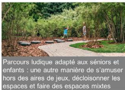
Parcours ludique adapté aux seniors et enfants : une autre manière de s'amuser hors des aires de jeux, décroisonner les espaces et faire des espaces mixtes