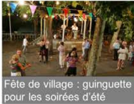
Fête de village : guinguette pour les soirées d'été