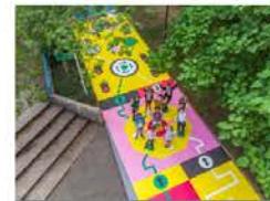
Usages ludiques et artistiques, peinture au sol