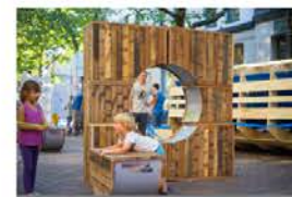
Mobilier ludique et d'assise en bois : « ce serait encore mieux avec une roue qui tourne »