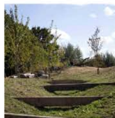
Gestion de l'eau pluviale : faire des équipements de infrastructures de jeux pour les enfants (« ce serait chouette de pouvoir y grimper ! »)

« Des tours d'observation pour voir les montagnes ! » (ou les oiseaux)