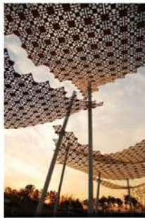
Ombrières : important pour faire de l'ombre sur les aires de jeux