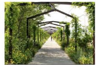
Ombrière végétalisée : « ce serait beau de faire un passage comme ça sur une portion du chemin »

« Des tours d'observation pour voir les montagnes ! » (ou les oiseaux)