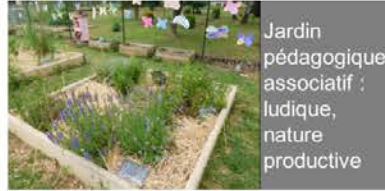
Jardin pédagogique associatif : ludique, nature productive