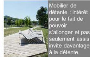
Mobilier de détente : intérêt pour le fait de pouvoir s'allonger et pas seulement assis, invite davantage à la détente.