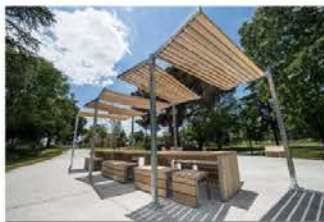
Ombrières: « ce serait bien pour pique niquer à l'ombre, ça ferait comme à McDo ! »

« Il ne faut surtout pas de lac ou de mare ! Ça attirerait les moustiques. »