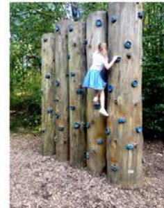
Parcours d'escalade, et des cordes, un parcours du combattant, une tyrolienne