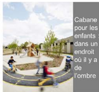
Cabane pour les enfants : dans un endroit où il y a de l'ombre