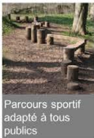
Parcours sportif adapté à tous publics