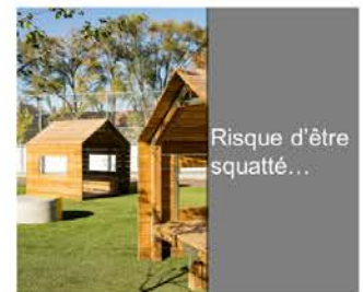
Risque d'être squatté...

Un point d'alerte sur les mobiliers en bois : une bonne idée de départ (harmonie paysagère, écologique) mais risques de dégradation avec le temps (échardes, pourrissement en cas d'humidité...). Un point d'attention à avoir sur le choix des matériaux en fonction de l'usage et de la localisation