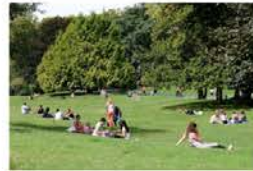
Pelouse libre : ce serait bien d'avoir des balançoires aussi, ou de quoi pique-niquer