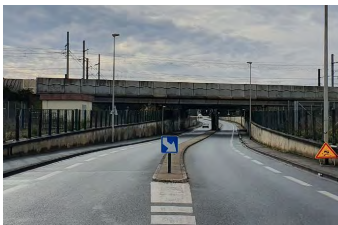
↑ Avenue Léon Blum @UneFabriquedelaVille