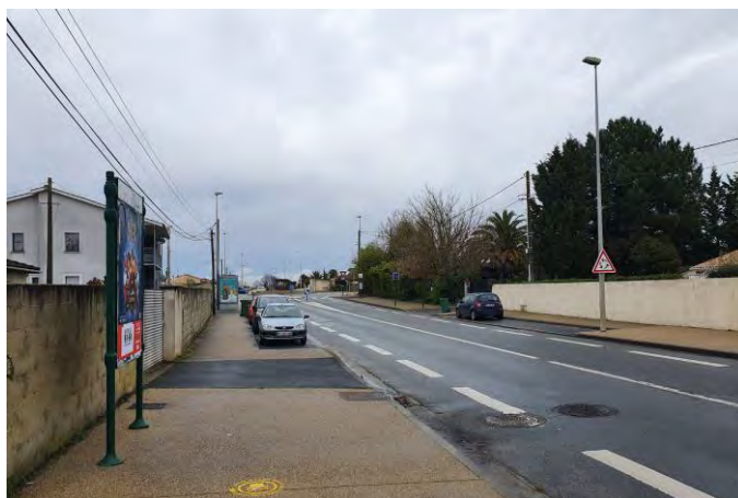
↑ Avenue Léon Blum @UneFabriquedelaVille