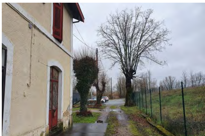
↑ Gare de la Grave d'Ambarès @UneFabriquedelaVille