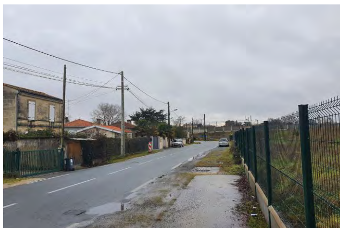
↑ Rue de Barbère @UneFabriquedelaVille