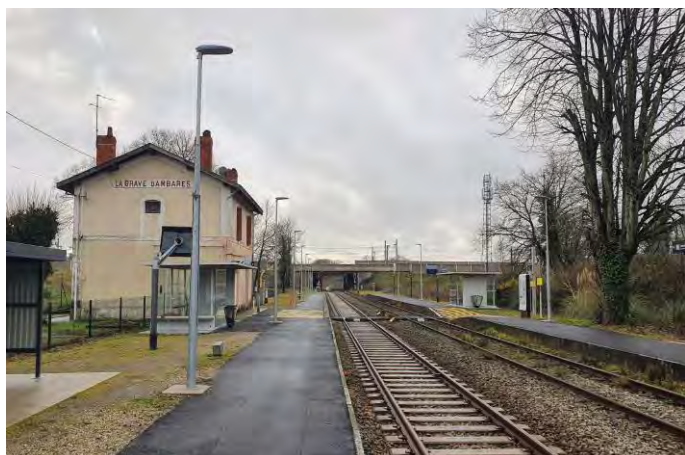
↑ Gare de la Grave d'Ambarès