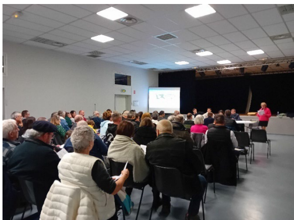
Réunion sectorielle à Saint-Louis-de-Montferrand, mardi 28 janvier 2025.