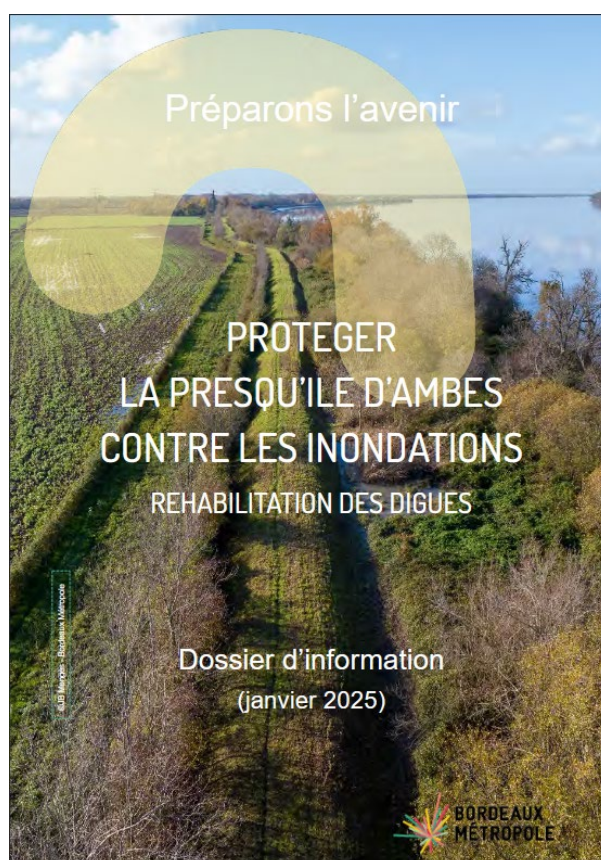
Figure 2 : Dossier d'information janvier 2025

Le dossier d'information (annexe 3) est accessible sur le site de la participation de Bordeaux Métropole dédié au projet : https://participation.bordeaux-metropole.fr/processes/digues-de-la-presquile-dambes