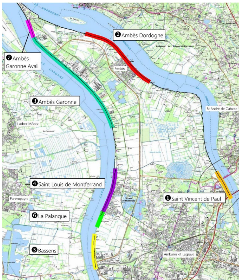
Figure 1 : Les secteurs concernés par le projet de réhabilitation des digues

A la suite d'une première phase de concertation volontaire des citoyens tenue du 28 septembre 2023 au 6 décembre 2023, le projet est désormais dans une phase opérationnelle, avec la définition du programme de travaux définitif. Un dispositif d'information ciblée est ainsi déployé entre le 28 et le 30 janvier 2025 dans les secteurs d'intervention : Saint-Louis-de-Montferrand, Ambès et Saint-Vincent-de-Paul.