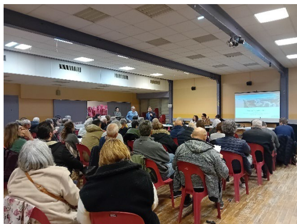
Réunion sectorielle à Ambès, mercredi 29 janvier 2025.