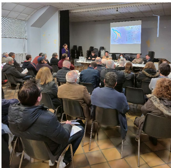
Réunion sectorielle à Saint-Vincent-de-Paul, jeudi 30 janvier 2025.