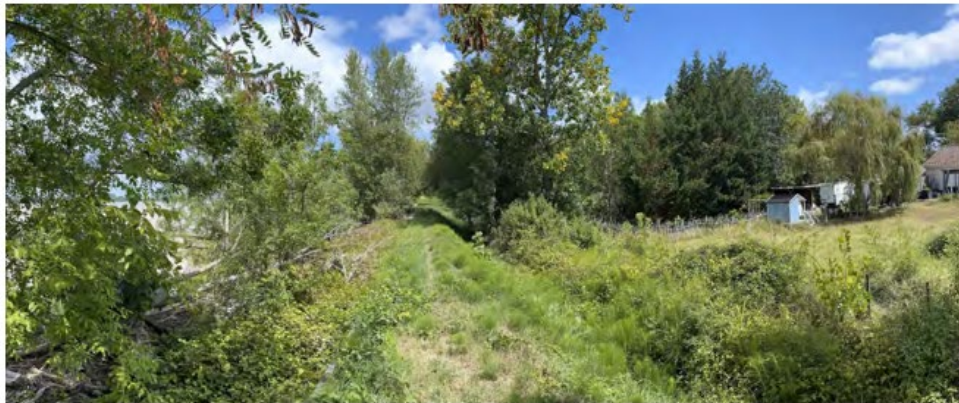
Principe du projet : la digue en béton épaulée d'un remblai de terre