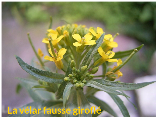
La vélar fausse giroflé

Et si on se mettait à la place des espèces ?