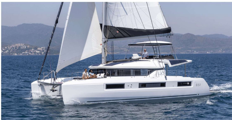
Photo Lagoon 51, lancé en 2022

Le groupe Beneteau a également fixé, au cœur de sa stratégie de développement, l'amélioration de « l'expérience client » (perceptions et émotions qu'une organisation procure à ses acheteurs lorsqu'ils entrent en contact avec elle). Cela englobe la qualité de notre offre produit et de service mais aussi la qualité de notre relation client. Pour CONSTRUCTION NAVALE BORDEAUX, l'expérience client réside notamment dans :