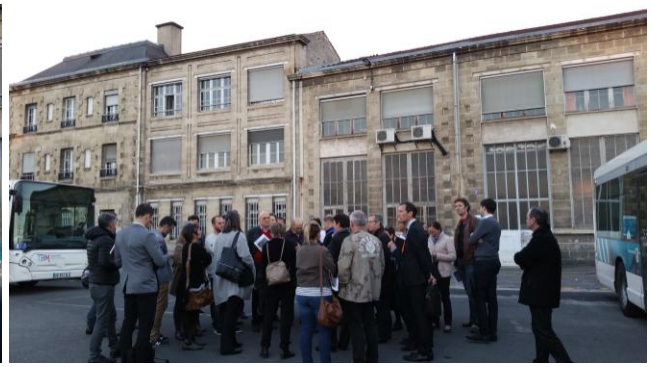
Le stationnement des bus :