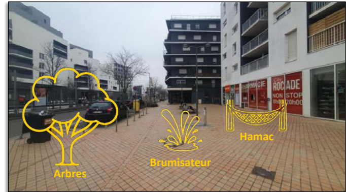
Une participante a réalisé un schéma avec une proposition d'aménagement du Cours du Québec