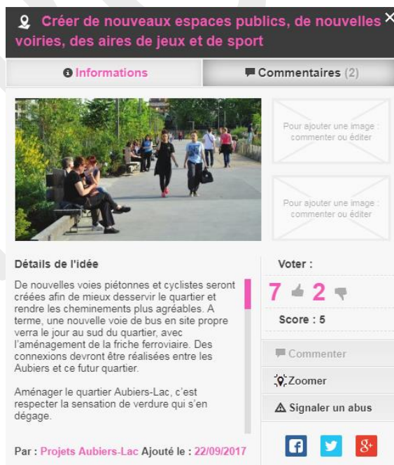
Fenêtre d'information pour une idée du site Carticipe

Carticipe est un outil de transparence. Les idées formulées sur le site apparaissent sous forme de bulle qui donnent accès à une fenêtre d'information comme présenté ci-dessous. Elle permet ainsi d'avoir les détails de l'idée, de consulter ou laisser un commentaire ainsi que de prendre connaissance des votes qu'elle a engendrés.