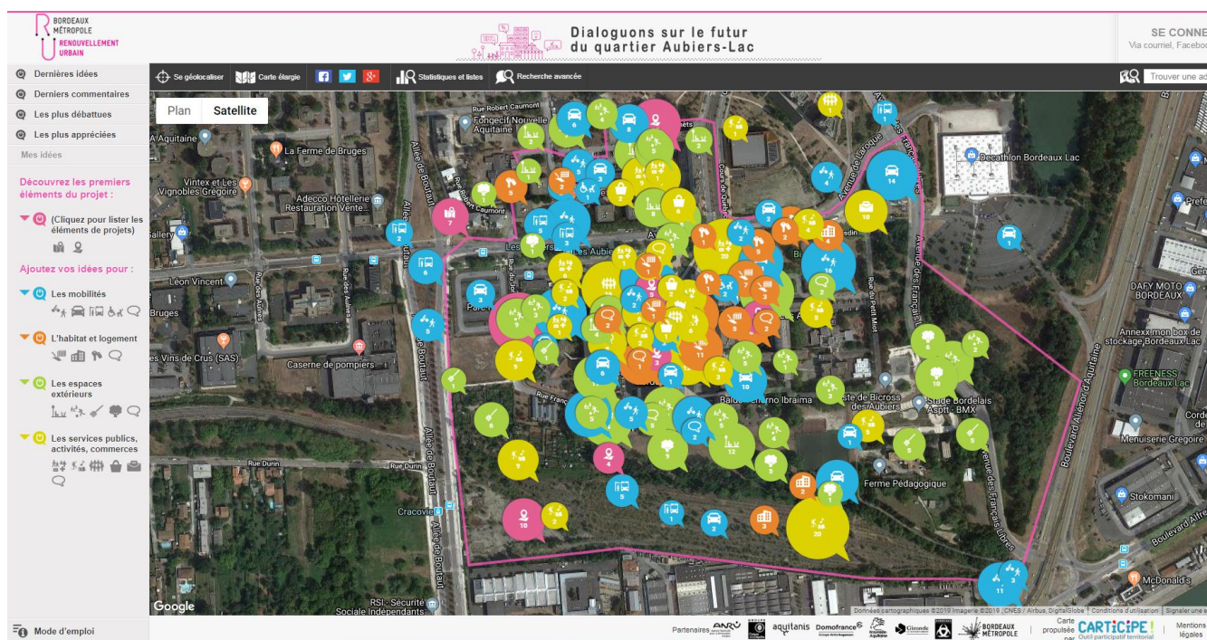
Site internet Carticipe spécifique au projet Aubiers-Lac

Carticipe est un outil de transparence. Les idées formulées sur le site apparaissent sous forme de bulle qui donnent accès à une fenêtre d'information comme présenté ci-dessous. Elle permet ainsi d'avoir les détails de l'idée, de consulter ou laisser un commentaire ainsi que de prendre connaissance des votes qu'elle a engendrés.