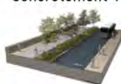
Perspective sur le quai haut des Queyries