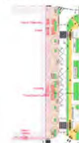
Plan masse du projet (AVP provisoire) identifiant les terrasses côté nord de la place