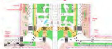
Plan masse du projet (AVP provisoire) identifiant la création des pistes cyclables matérialisée en cœur de place et la création d'une traversée piétonne des voies du tramway séparée.