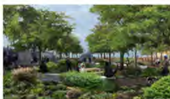
Perspective sur le cœur de la place de Stalingrad