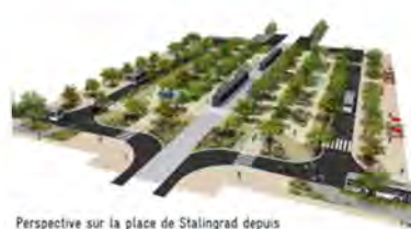
Perspective sur la place de Stalingrad depuis le pont de pierre