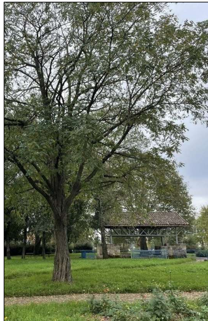
Les Prés Lacoste, à Bègles

Un jardin de proximité, en quartier résidentiel