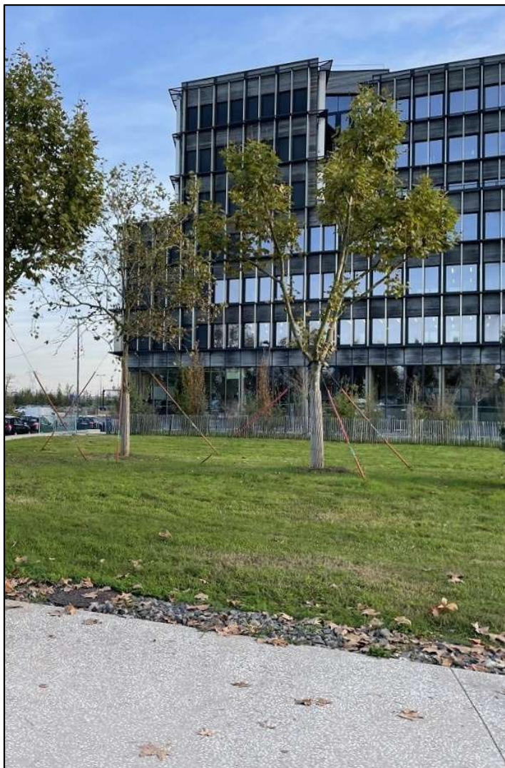
Le quartier Belcier, à Bordeaux