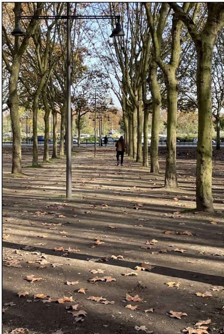
La Platanaie des Quinconces, à Bordeaux