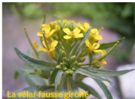
La vélar fausse giroflée

" Planter plus d'arbres et mettre plus de terre "