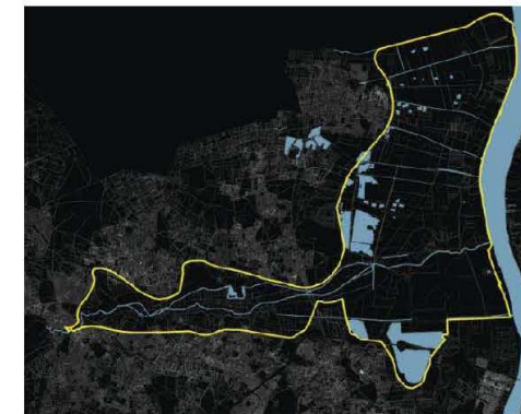
Périmètre du Parc en 2008

Aujourd'hui, et à la suite du comité de pilotage du 1er février 2019, un projet de périmètre se déploie sur 10 communes : Blanquefort, Bordeaux, Bruges, Eysines, Le Haillan, Le Taillan-Médoc, Martignas-sur-Jalle, Parempuyre, Saint-Aubin-de-Médoc et Saint-Médard-en-Jalles, et totalise 5 952 hectares. Le périmètre s'étend donc à présent, sur le territoire métropolitain, des têtes des bassins versants des jalles jusqu'aux marais et embouchures des jalles à l'aval, en bordure de Garonne. En effet, les deux communes ajoutées sont situées à l'amont du réseau hydrographiques des jalles. Il compte également sur son territoire des espaces forestiers, porteurs de projets de territoire, inscrits notamment dans le SCoT.