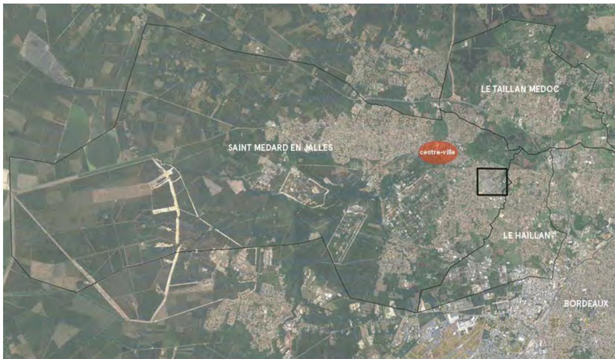
Localisation du site à l'échelle métropolitaine

Située au Nord-Ouest de Bordeaux, en deuxième couronne de l'agglomération bordelaise, la commune de Saint-Médard-en-Jalles compte un peu plus de 31 000 habitants. Le secteur de Berlincan est situé en entrée de ville à la limite avec la commune du Haillan.