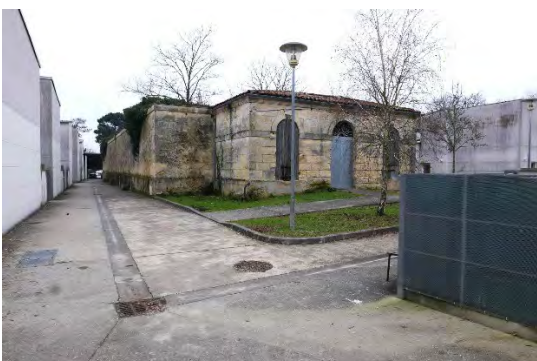
L'ancienne poudrière, aujourd'hui masquée par une résidence de maisons groupées