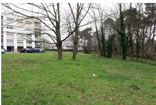
Le site est bordé au Nord par une lisière végétale : les espaces boisés de la Jalle