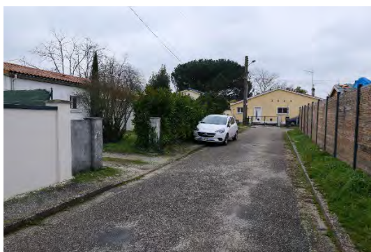
Les abords du site sont essentiellement des quartiers de pavillons individuels