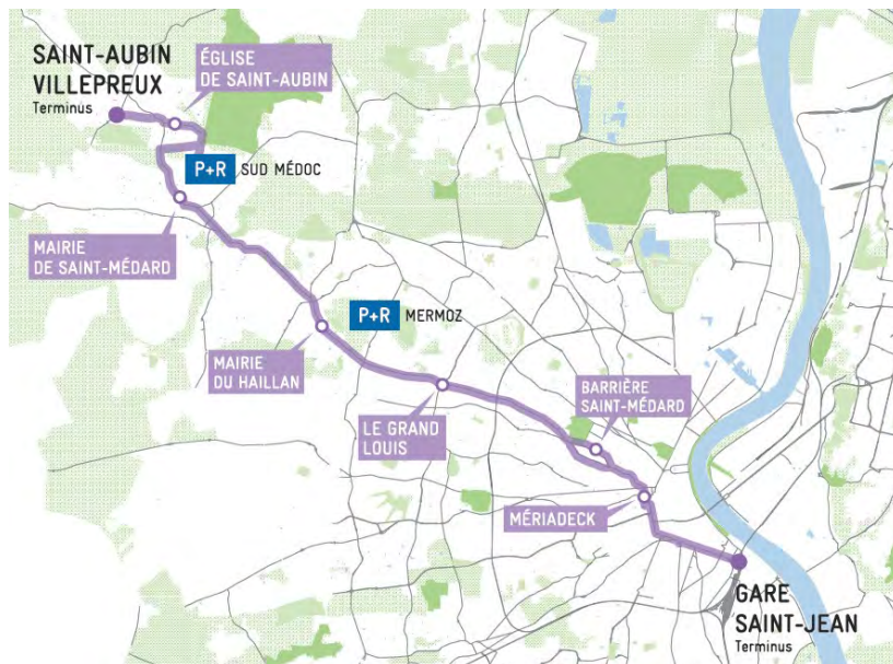
Tracé du BHNS liaison Bordeaux Gare Saint-Jean – Saint-Aubin de Médoc

Le site verra l'arrivée d'un futur Bus à Haut Niveau de Service fin 2024, projet porté par Bordeaux Métropole, dont le tracé passera par l'avenue Descartes avec la station «Centre commercial Saint-Médard» prévue au droit du site de Berlincan. La ligne reliera la gare Saint-Jean de Bordeaux à Saint-Aubin de Médoc en passant par les communes de Mérignac, Eysines, Le Haillan et Saint-Médard-en-Jalles.