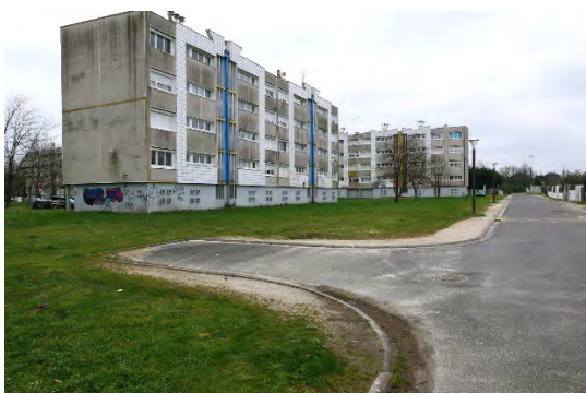
Les résidences Berlincan sont sujettes à un projet de requalification, ainsi que les espaces publics et voiries du quartier résidentiel