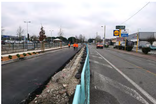
L'avenue Descartes en travaux en vue de l'arrivée du BHNS, bordée par les commerces et enseignes