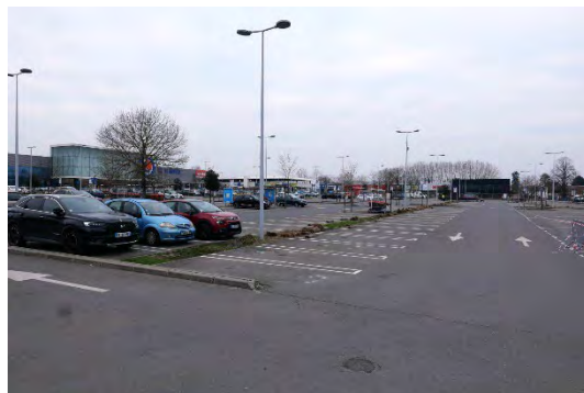
Les parkings sont omniprésents, très minéraux et participent à l'effet de chaleur urbain