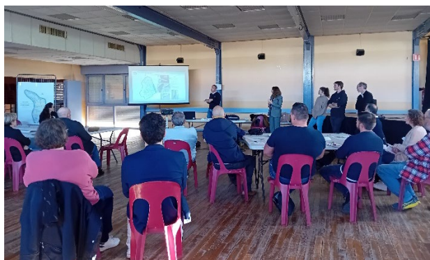
Atelier « Retour d'expérience et projection », 22 avril 2025 à Ambès.