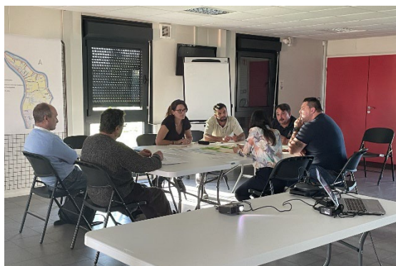
Atelier de diagnostic, mercredi 9 avril 2025 à Saint-Louis-de-Montferrand.

Chaque atelier s'est structuré autour d'un temps de présentation du projet par l'équipe projet, de la présentation du cycle d'atelier et de ses principaux enseignements ainsi que de deux temps participatifs. Par ailleurs, un intervenant extérieur a été convié à présenter un retour d'expérience lors de l'atelier « Retour d'expérience et projection ».