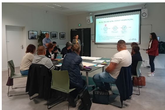
Atelier « Patrimoine et usages », 14 avril 2025 à Bassens.