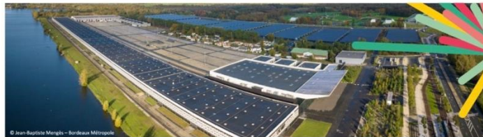
Concertation sur le renouvellement du Parc des Expositions Ateliers acteurs en ligne

L'atelier acteurs en acteurs qui fait l'objet du présent compte-rendu a été organisée le 27 mai 2025 de 14h à 16h en ligne, dans le cadre de la concertation réglementaire portant sur le projet de renouvellement du Parc des Expositions. 5 personnes étaient présentes. 12 personnes s'étaient inscrites.