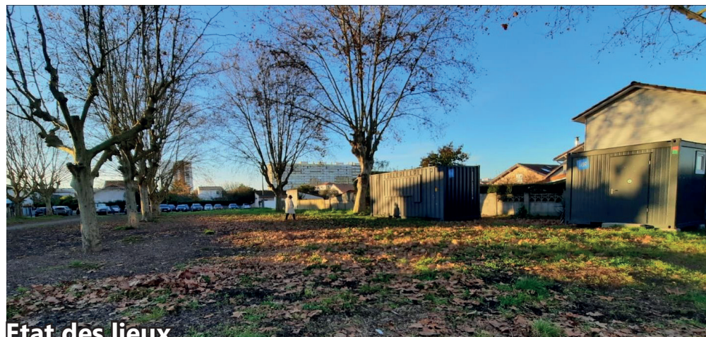
Etat des lieux