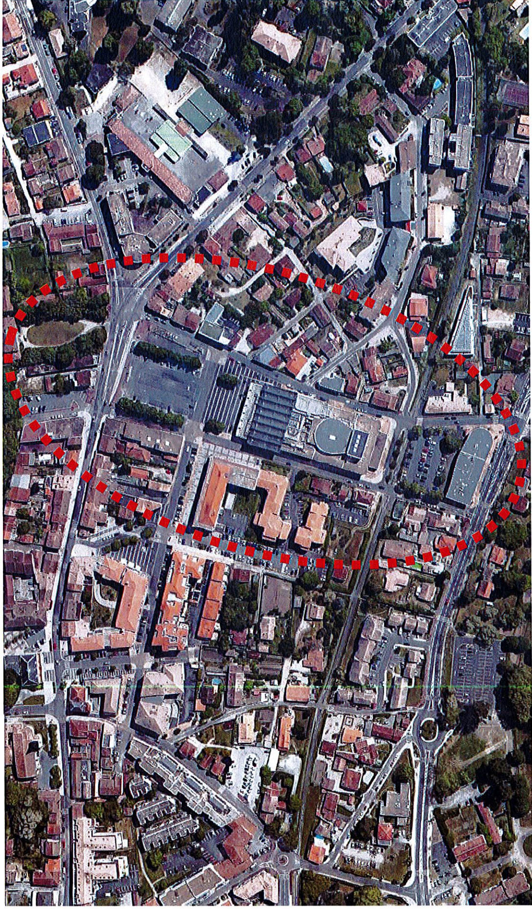
Saint-Médard-en-Jalles - Place de la République et abords immédiats