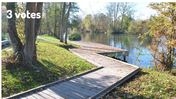
Promenade en bois

« La promenade en bois, c'est super pour que les enfants évitent les rues goudronnées »