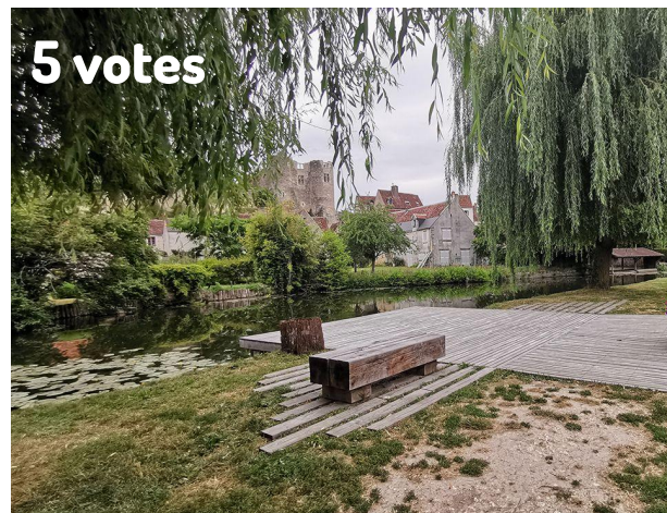
Aménagement en bord de rivière

« La promenade en bois, c'est super pour que les enfants évitent les rues goudronnées »