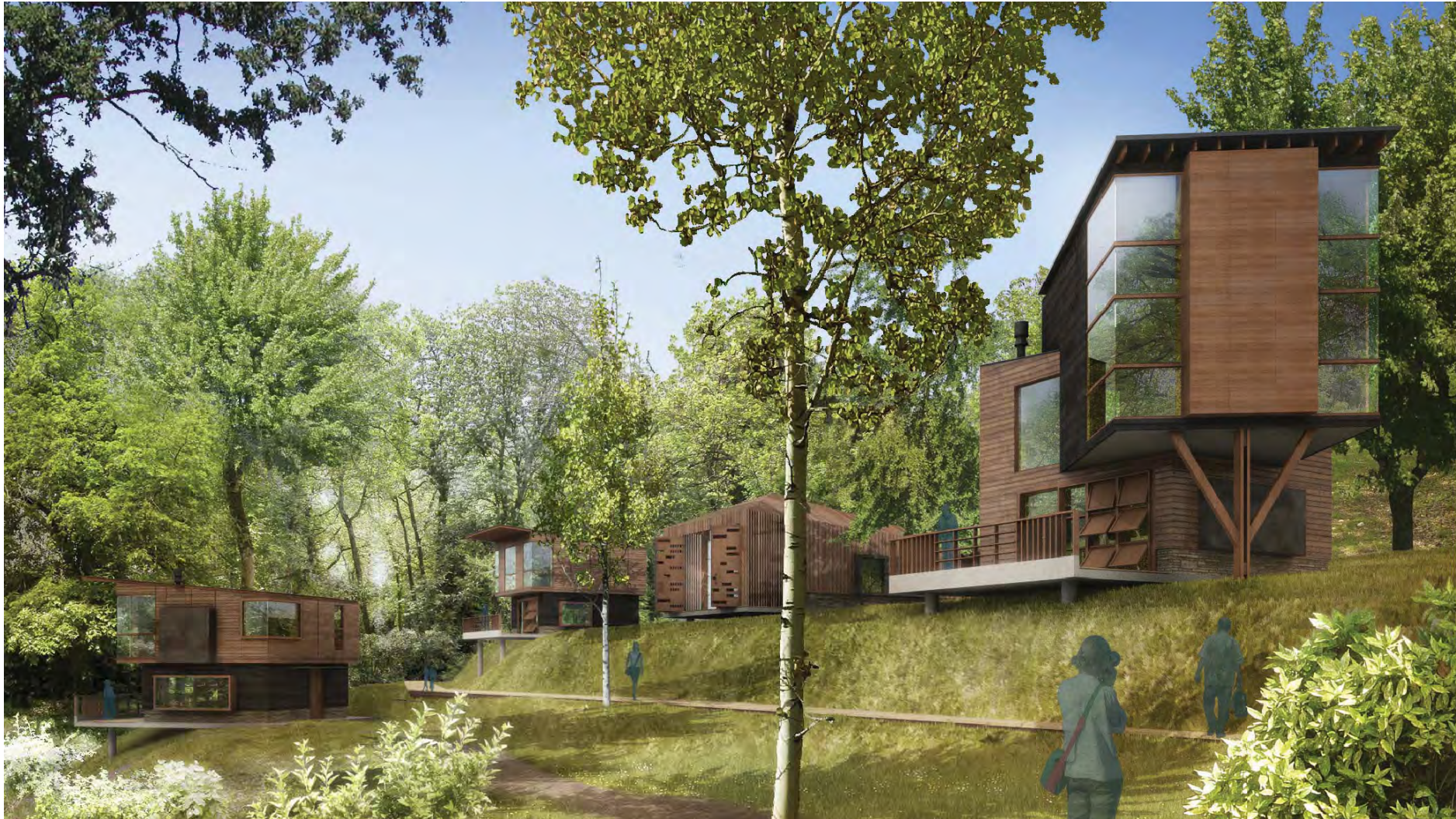
Vue sur les cabanes