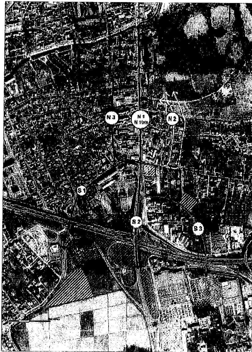
Figure 26-Proposition de tracés